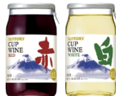
カップワイン 赤・白