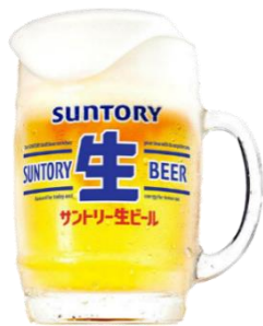
サントリー生ビール樽