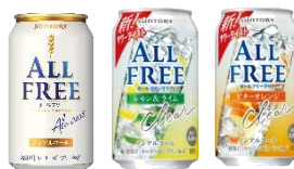
オールフリー 350ml缶 オールフリークリア 350ml缶 レモン&ライム/ビターオレンジ