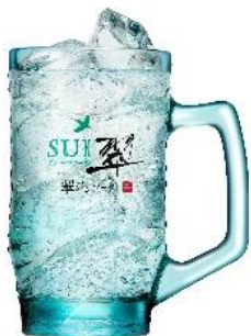
翠ジンソニック 翠ジンソーダ 翠ジンソーダ柚子