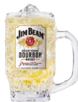
ジムビームハイボール